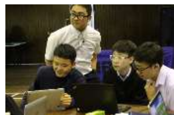
<ディスカッションとまとめの発表>