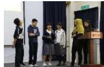
<まとめの発表と校内案内>