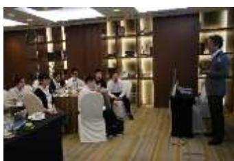
<日本旅行シンガポール社長講話>